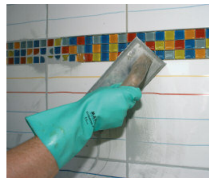
Eenvoudig te verwerken, temperatuurafhankelijke voegmortel. PCI Nanofug wordt gemakkelijk in de voeg gewerkt.